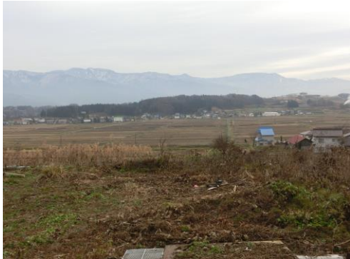
↑ 物件敷地から見える風景