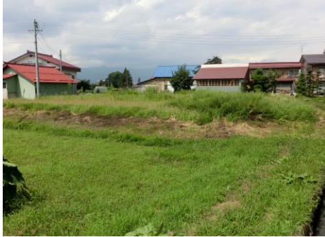
↑ 物件敷地から見える風景