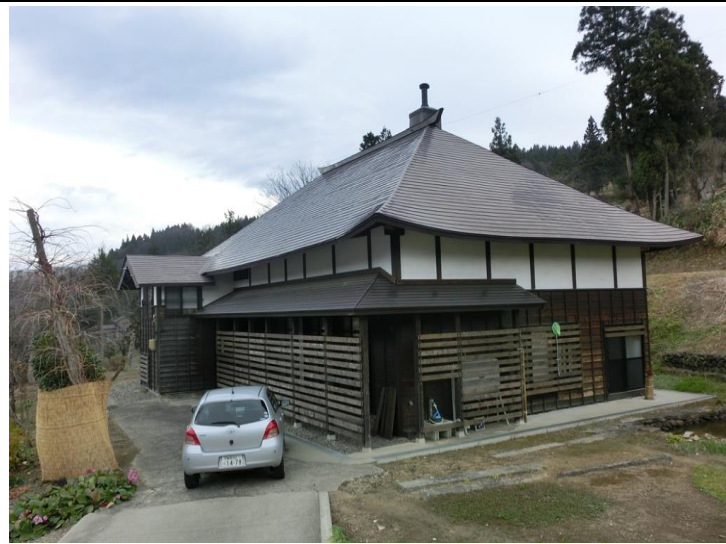
そのほかの写真、間取り図