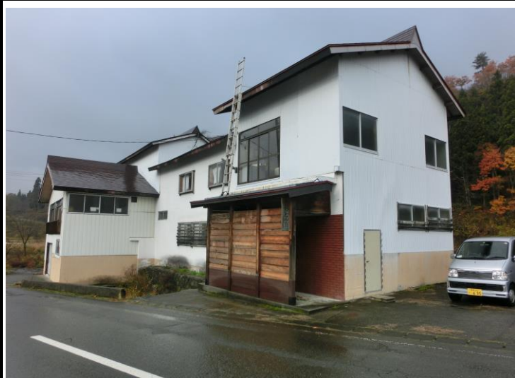
そのほかの写真、間取り図