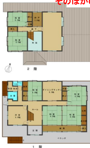
そのほかの写真、間取り図