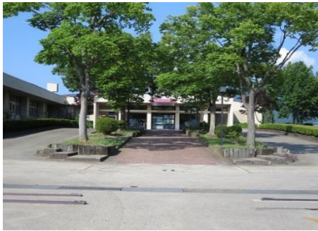
飯山養護学校 10.6km 車で16分

市内施設等(所要時間等は登録日時点です。開閉館日、定休日等は各施設等にお問い合わせください。)