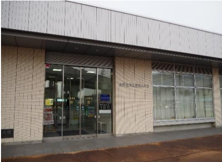
長野信用金庫 飯山支店 10.2km 車で14分

市内施設等(所要時間等は登録日時点です。開閉館日、定休日等は各施設等にお問い合わせください。)