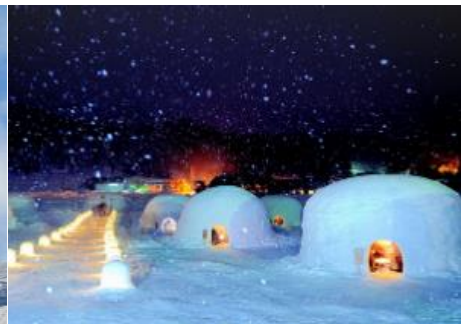
かまくらの里 2.4km 車で4分