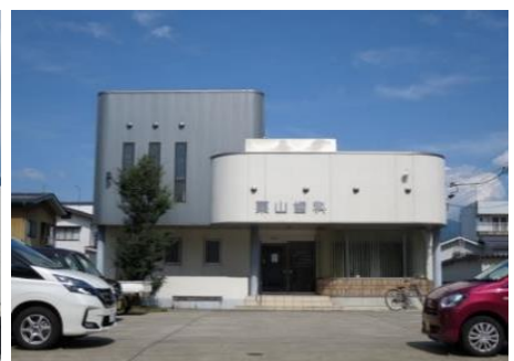
栗山歯科診療所 9.0km 車で12分 歯科