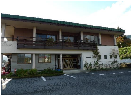
太田地区活性化センター(市出先機関) 1.3km 車で2分