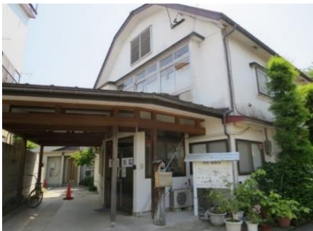
片塩医院 9.3km 車で14分 内科/麻酔科