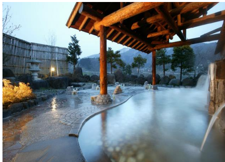
いいやま湯滝温泉 5.6km 車で10分