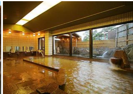
斑尾高原温泉 16.2km 車で25分