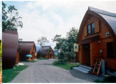
なべくら高原・森の家 10.8km 車で16分