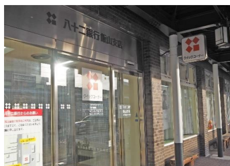
八十二銀行 飯山支店 8.8km 車で12分