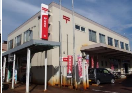
飯山郵便局 8.6km 車で15分