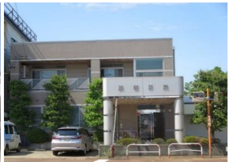
服部医院 9.7km 車で14分 内科/循環器科/小児科