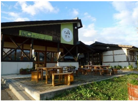
道の駅 花の駅・千曲川 5.9km 車で9分