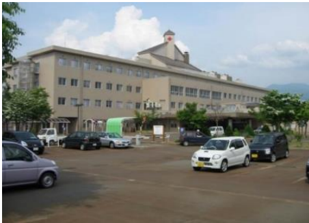
飯山赤十字病院 10.1km 車で14分

市内施設等(所要時間等は登録日時点です。開閉館日、定休日等は各施設等にお問い合わせください。)