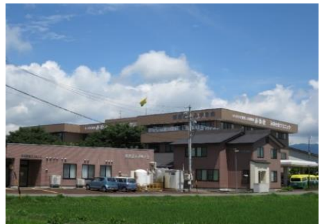
みゆき会クリニック 10.9km 車で16分 内科/婦人科/リウマチ科/内視鏡科