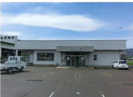
JAながの 常盤支所 5.2km 車で9分