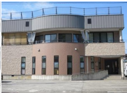
ふじまき歯科 1.7km 車で3分 歯科