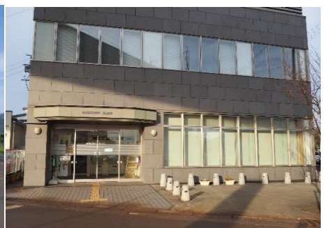
長野県信用組合 飯山支店 10.3km 車で16分