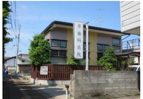
岸歯科医院 10.1km 車で15分 歯科