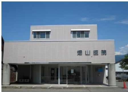
畑山医院 9.7km 車で14分 内科/循環器科/小児科