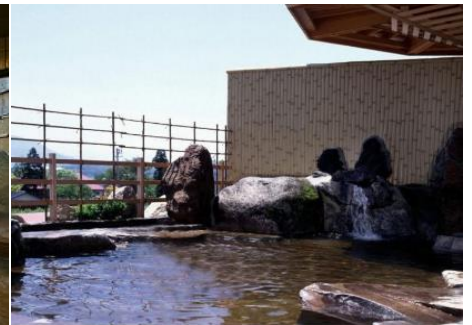
戸狩温泉 暁の湯 1.9km 車で3分