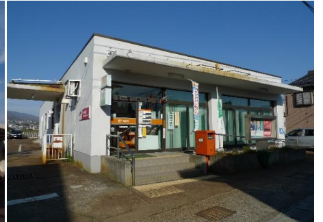
常盤郵便局 1.4km 車で2分