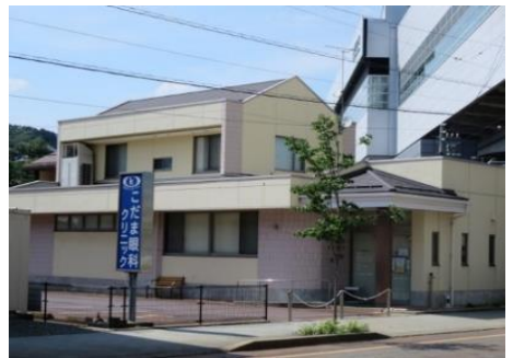
こだま眼科クリニック 9.7km 車で14分 眼科