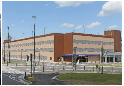
飯山駅斑尾口駐車場(立体・平面駐車場) 9.6km 車で12分