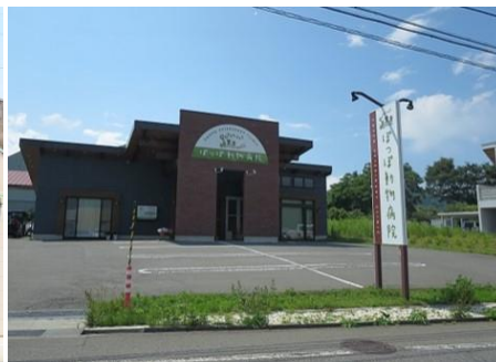
ぼっぼ動物病院 11.9km 車で16分