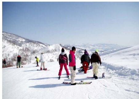
戸狩温泉スキー場 2.4km 車で5分