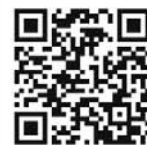
中古住宅物件情報はこちら