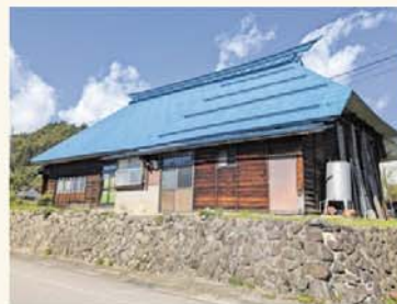
飯山市空き家バンク