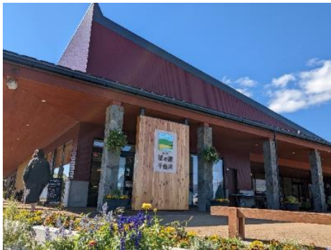
道の駅 花の駅・千曲川 5.8km 車で10分