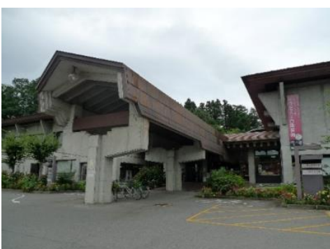
飯山市公民館・いいやま地区活性化センター(市出先機関) 1.3km 車で3分