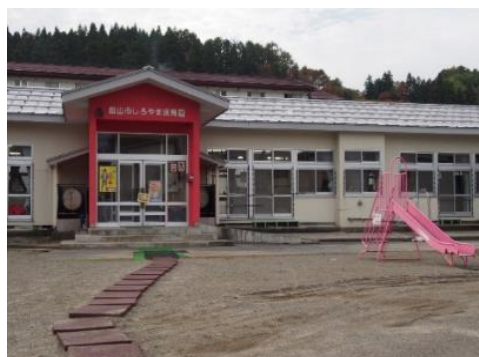
飯山市立 しroyama保育園 2.0km 車で5分