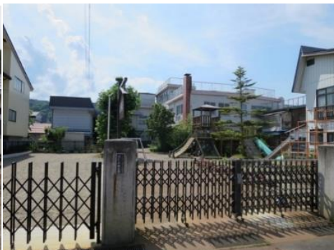
私立 めぐみ保育園 1.2km 車で4分