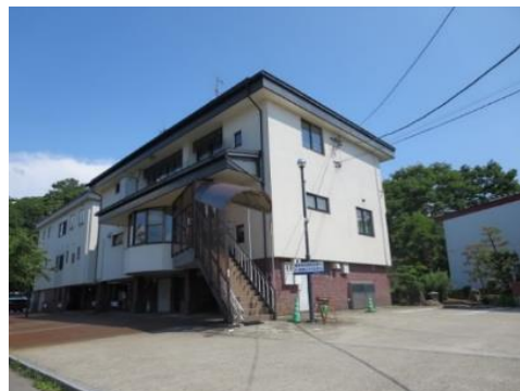
内山歯科クリニック 2.3km 車で6分 歯科

市内施設等(所要時間等は登録日時点です。開閉館日、定休・店休日等は各施設等にお問い合わせください。)