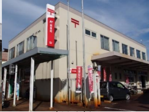
飯山郵便局 1.2km 車で4分