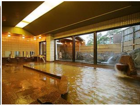
斑尾高原温泉 11.2km 車で19分