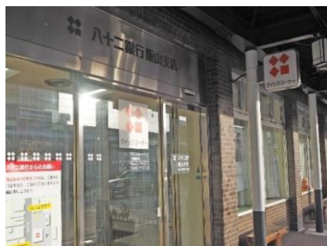
八十二銀行 飯山支店 1.6km 車で4分