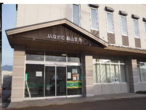
JAながの 飯山支所 1.7km 車で5分