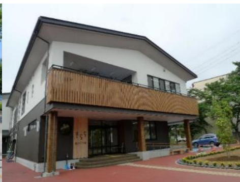
飯山市子ども館「きらら」 1.9km 車で6分