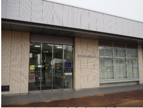
長野信用金庫 飯山支店 0.6km 車で2分

市内施設等(所要時間等は登録日時点です。開閉館日、定休・店休日等は各施設等にお問い合わせください。)