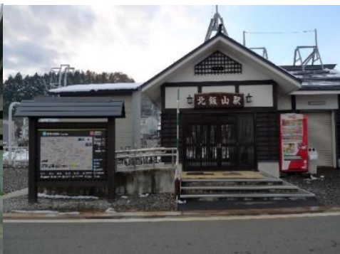
JR飯山線 北飯山駅 2.2km 車で6分