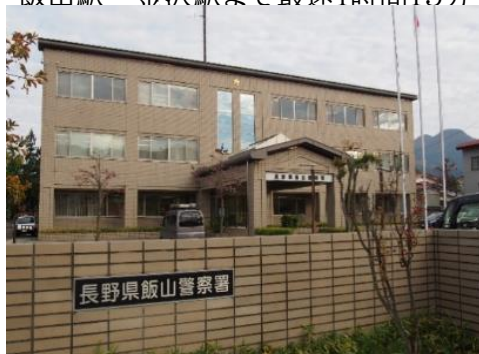
飯山警察署 0.9km 車で3分