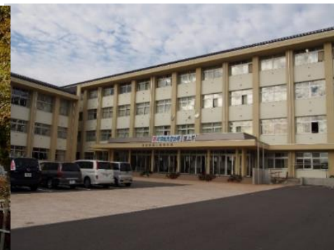
長野県飯山高等学校 2.5km 車で7分