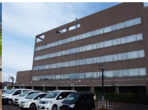
飯山市役所 1.7km 車で5分