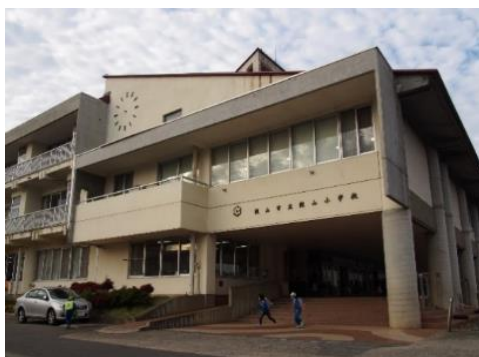
飯山市立 飯山小学校 2.1km 車で5分