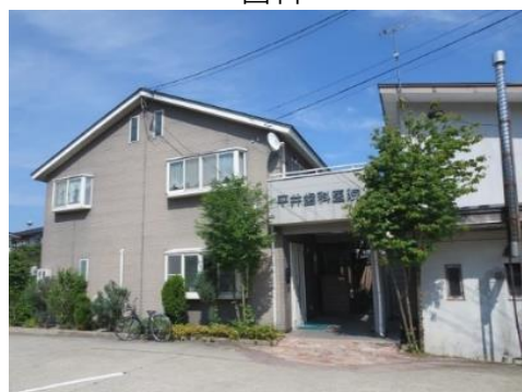
平井歯科医院 2.3km 車で6分 歯科