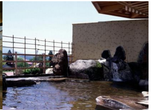
戸狩温泉 暁の湯 12.2km 車で18分