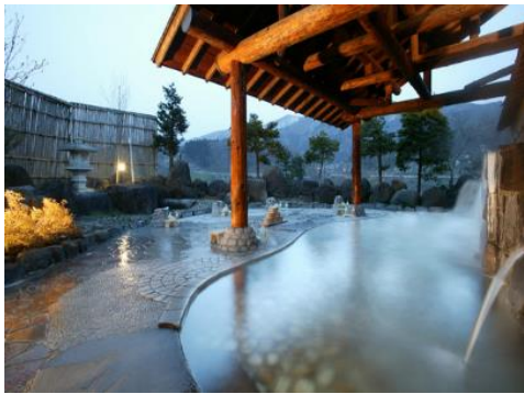
いよいよ湯滝温泉 13.5km 車で19分