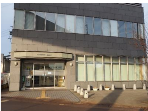
長野県信用組合 飯山支店 0.6km 車で2分