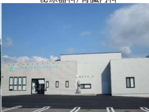
いいやまファミリークリニック 2.1km 車で5分 内科/整形外科/脳神経外科/小児科 外科/麻酔科/リハビリテーション科