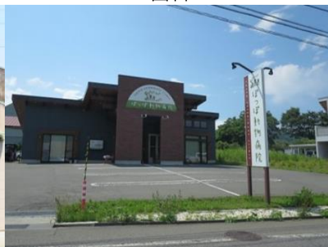
ぼっぼ動物病院 2.4km 車で6分