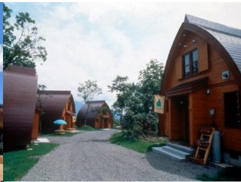
なべくら高原・森の家 19.7km 車で30分