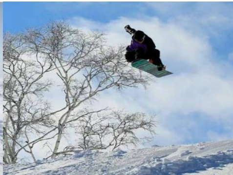
斑尾高原スキー場 11.3km 車で19分