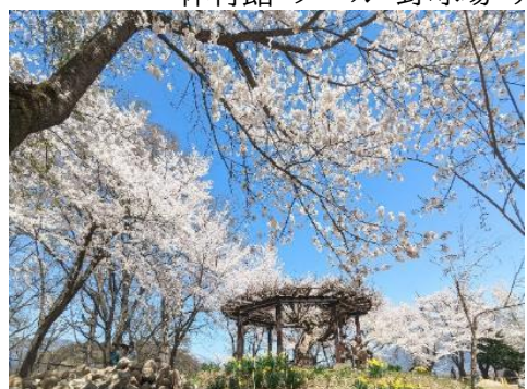
飯山城址公園 2.1km 車で5分

体育館・プール・野球場・テニスコート・マレットゴルフ・多目的運動場・クロスカントリースキー