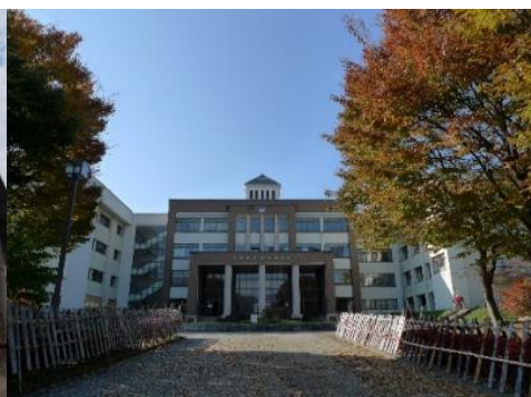
飯山市立 城南中学校 1.5km 車で4分 徒歩22分