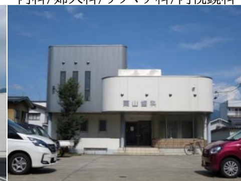
栗山歯科診療所 1.9km 車で6分 歯科