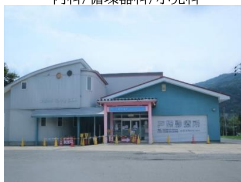
戸狩診療所 9.8km 車で17分 外科/整形外科/形成外科/美容外科/リハビリテーション科