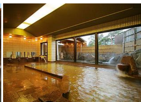
斑尾高原温泉 19.2km 車で27分