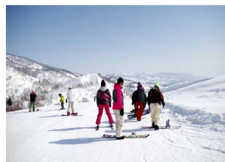
戸狩温泉スキー場 3.6km 車で7分