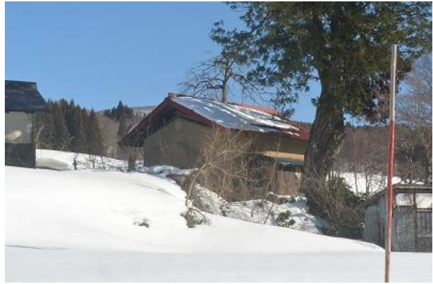
接道 (市道4-444号 幅員6.5m 除雪路線)