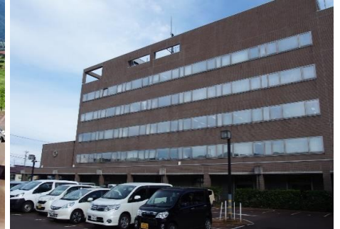
飯山市役所 9.8km 車で14分