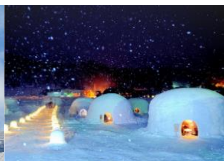
かまくらの里 5.8km 車で9分