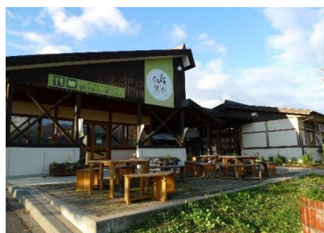
道の駅 花の駅・千曲川 5.4km 車で7分