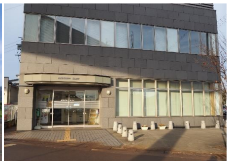
長野県信用組合 飯山支店 10.7km 車で15分