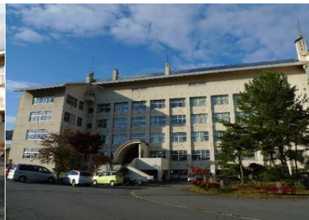
飯山市立 城北中学校 2.4km 車で5分