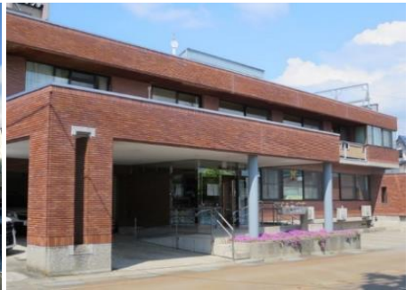
小田切医院 9.2km 車で13分 内科/小児科/外科/整形外科/肛門科 他