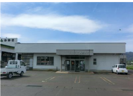
JAながの 常盤支所 5.7km 車で8分