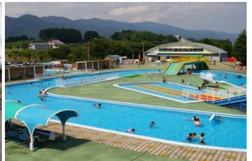
長峰スポーツ公園 6.8km 車で10分 体育館・プール・野球場・テニスコート・マレットゴルフ・多目的運動場・クロスカントリースキー