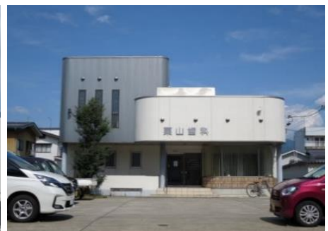
栗山歯科診療所 9.5km 車で13分 歯科