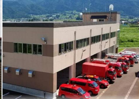
岳北消防本部 9.4km 車で12分