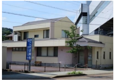
こだま眼科クリニック 11.0km 車で15分 眼科