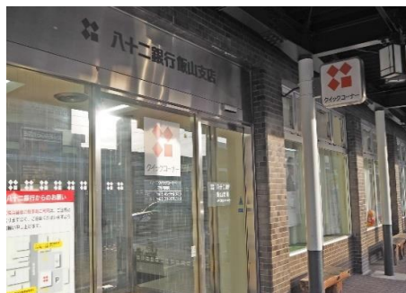
八十二銀行 飯山支店 9.4km 車で14分