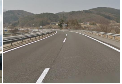
上信越自動車道 豊田飯山IC 17.2km 車で25分