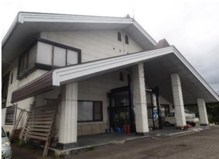
瑞穂地区活性化センター(市出先機関) 4.7km 車で7分