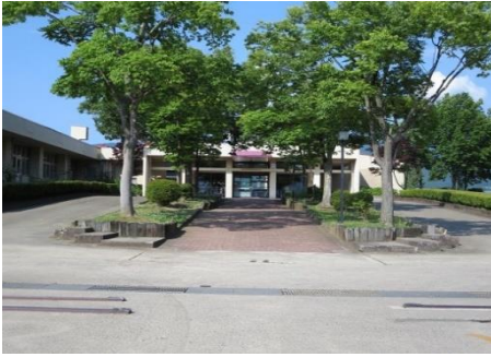
飯山養護学校 10.4km 車で15分

市内施設等(所要時間等は登録日時点です。開閉館日、定休日等は各施設等にお問い合わせください。)