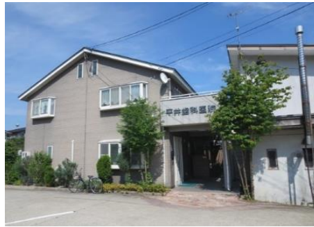
平井歯科医院 8.9km 車で12分 歯科