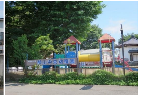
私立 飯山中央幼稚園 10.0km 車で16分