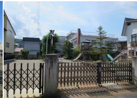
私立 めぐみ保育園 9.9km 車で16分