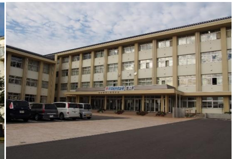
長野県飯山高等学校 8.8km 車で12分