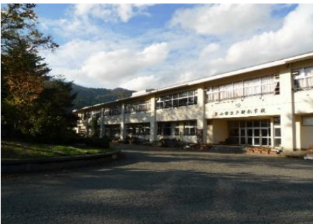
飯山市立 戸狩小学校 2.3km 車で5分