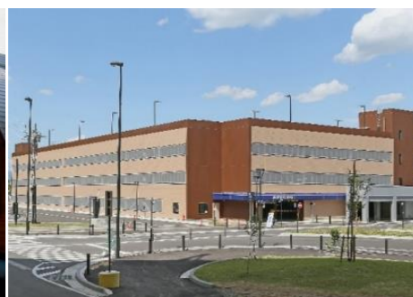
飯山駅斑尾口駐車場(立体・平面駐車場) 10.4km 車で15分