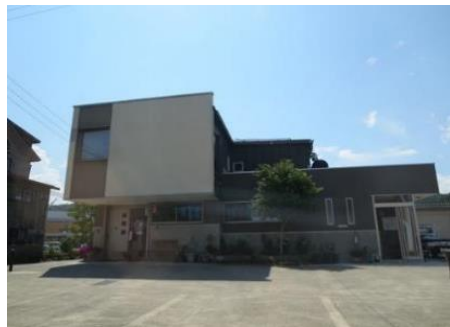
いいやま診療所 10.4km 車で15分 泌尿器科/腎臓内科