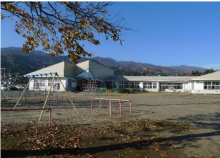
飯山市立 とがり保育園 2.6km 車で5分