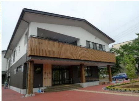
飯山市こども館「きらら」 9.3km 車で13分