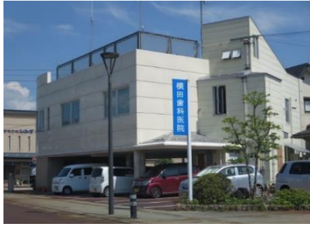
横田歯科医院 10.3km 車で16分 歯科