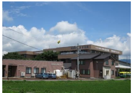
みゆき会クリニック 9.6km 車で14分 内科/婦人科/リウマチ科/内視鏡科