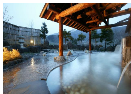
いいやま湯滝温泉 2.3km 車で4分