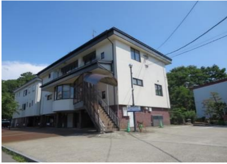
内山歯科クリニック 8.9km 車で12分 歯科

市内施設等(所要時間等は登録日時点です。開閉館日、定休日等は各施設等にお問い合わせください。)