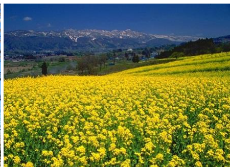
飯山菜の花公園 5.1km 車で9分