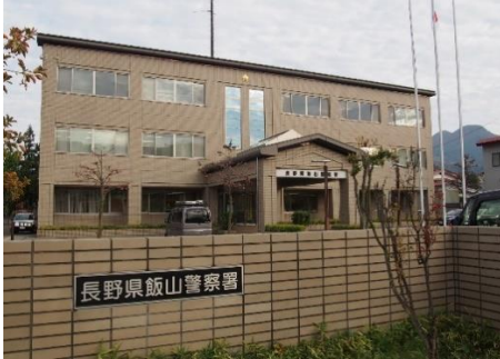
飯山警察署 10.3km 車で15分