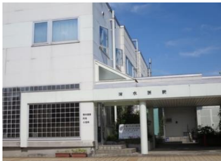
清水医院 9.1km 車で13分 内科/小児科