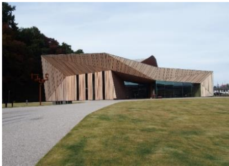
飯山市文化交流館「なちゅら」 10.1km 車で16分