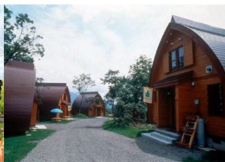
なべくら高原・森の家 11.4km 車で16分