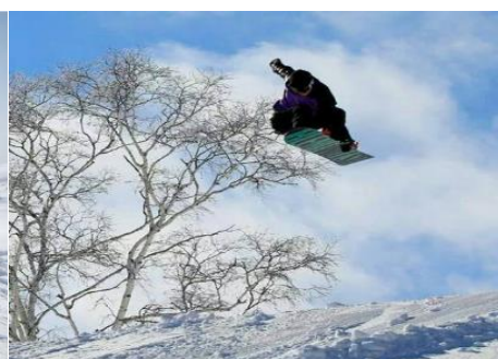
斑尾高原スキー場 19.3km 車で27分