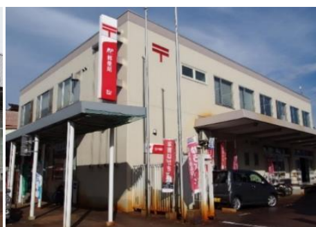
飯山郵便局 10.0km 車で14分