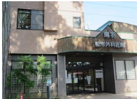
鳥羽整形外科医院 10.3km 車で14分