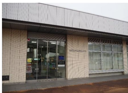
長野信用金庫 飯山支店 10.4km 車で15分

市内施設等(所要時間等は登録日時点です。開閉館日、定休日等は各施設等にお問い合わせください。)