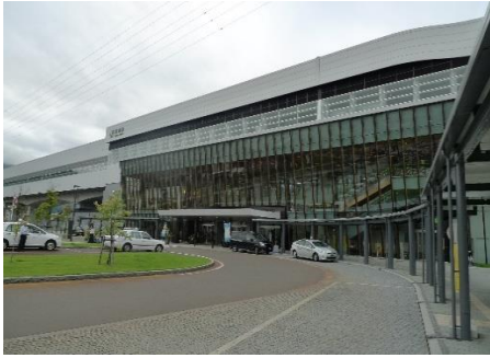
JR飯山駅(北陸新幹線停車駅) 11.1km 車で17分

市内施設等(所要時間等は登録日時点です。開閉館日、定休日等は各施設等にお問い合わせください。)