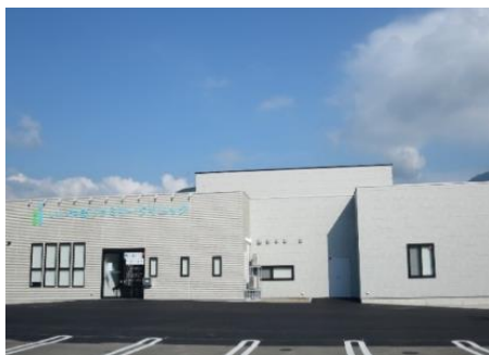
いいやまファミリークリニック 12.3km 車で18分 内科/整形外科/脳神経外科/小児科 外科/麻酔科/リハビリテーション科