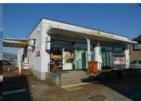
常盤郵便局 2.2km 車で4分