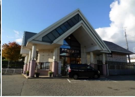
JR飯山線 戸狩野沢温泉駅 1.6km 車で3分