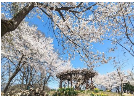
飯山城址公園 9.2km 車で13分