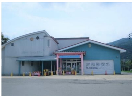
戸狩診療所 2.3km 車で5分 外科/整形外科/形成外科/美容外科/リハビリテーション科