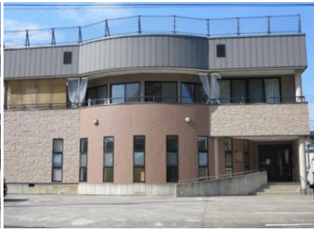
ふじまき歯科 1.7km 車で4分 歯科