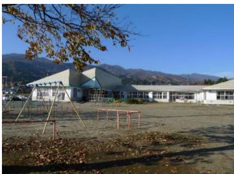
飯山市立 とがり保育園 2.0km 車で3分