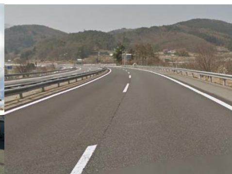
上信越自動車道 豊田飯山IC 17.4km 車で22分