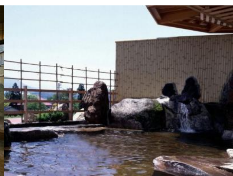
戸狩温泉 暁の湯 0.45km 車で2分