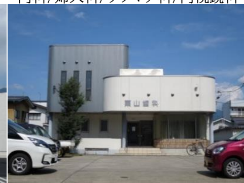
栗山歯科診療所 9.7km 車で15分 歯科