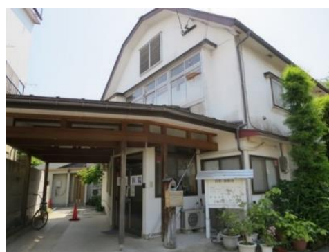
片塩医院 10.2km 車で16分 内科/麻酔科