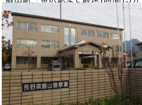
飯山警察署 10.3km 車で17分