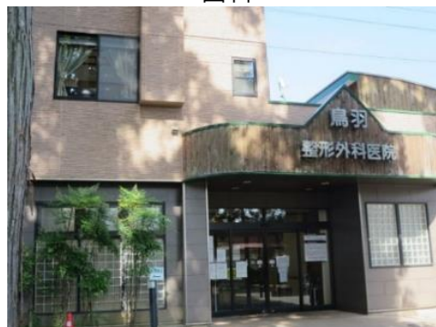
鳥羽整形外科医院 10.5km 車で17分 整形外科/リウマチ科/リハビリテーション科/麻酔科