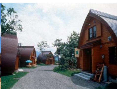
なべくら高原・森の家 8.6km 車で12分