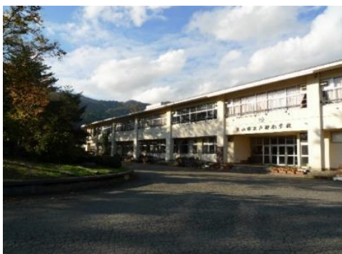
飯山市立 戸狩小学校 1.4km 車で2分