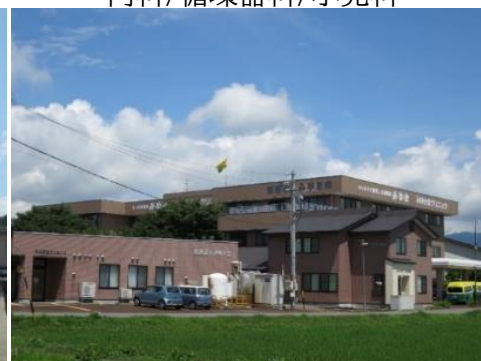
みゆき会クリニック 11.3km 車で17分 内科/婦人科/リウマチ科/内視鏡科