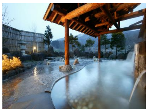
いいやま湯滝温泉 3.6km 車で6分