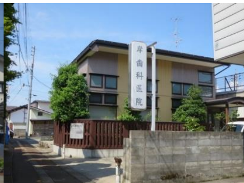
岸歯科医院 10.6km 車で17分 歯科