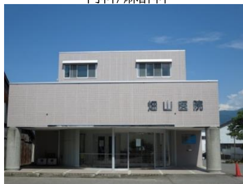
畑山医院 10.1km 車で16分 内科/循環器科/小児科