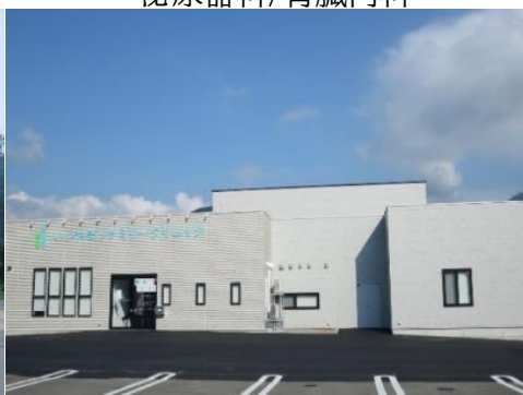
いいやまファミリークリニック 12.3km 車で18分 内科/整形外科/脳神経外科/小児科 外科/麻酔科/リハビリテーション科