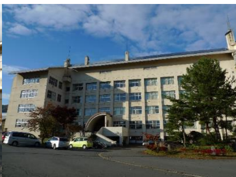
飯山市立 城北中学校 2.8km 車で5分