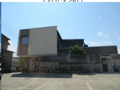
いいやま診療所 10.4km 車で16分 泌尿器科/腎臓内科