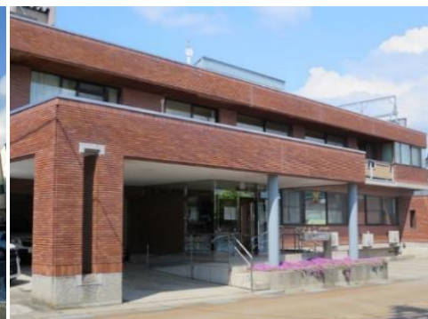
小田切医院 9.3km 車で15分 内科/小児科/外科/整形外科/肛門科 他