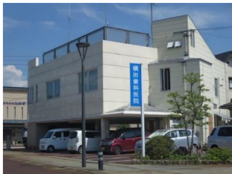
横田歯科医院 10.5km 車で17分 歯科