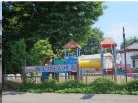
私立 飯山中央幼稚園 10.1km 車で17分