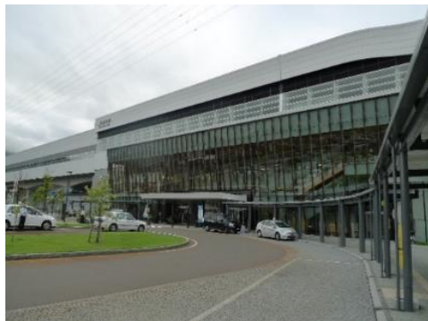
JR飯山駅(北陸新幹線停車駅) 11.3km 車で18分

市内施設等(所要時間等は登録日時点です。開閉館日、定休・店休日等は各施設等にお問い合わせください。)