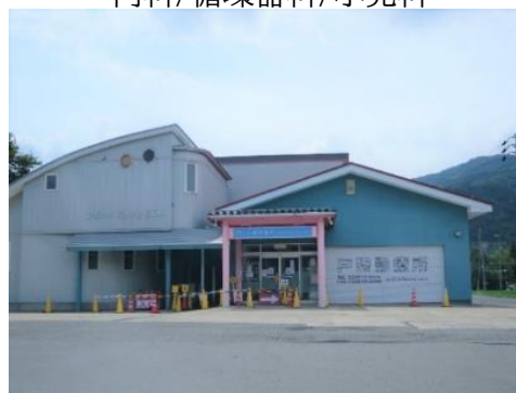
戸狩診療所 1.6km 車で3分 外科/整形外科/形成外科/美容外科/リハビリテーション科