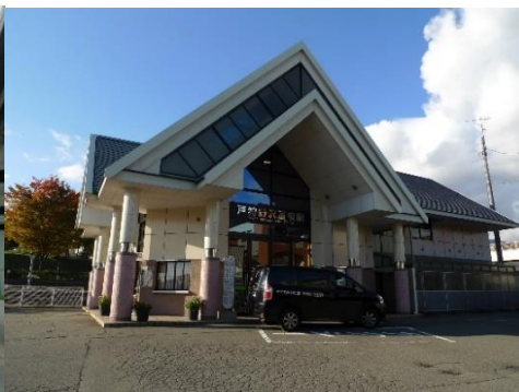
JR飯山線 戸狩野沢温泉駅 1.9km 車で4分