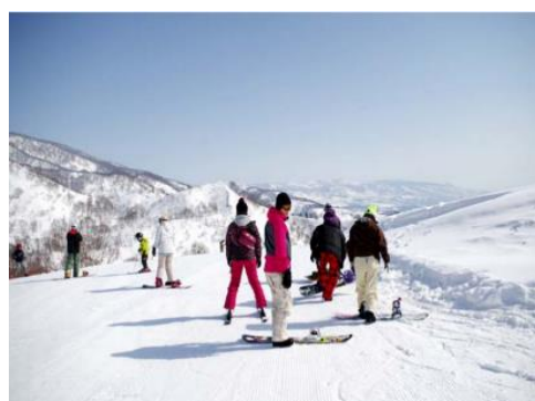
戸狩温泉スキー場 0.5km 車で2分