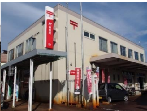
飯山郵便局 10.1km 車で16分