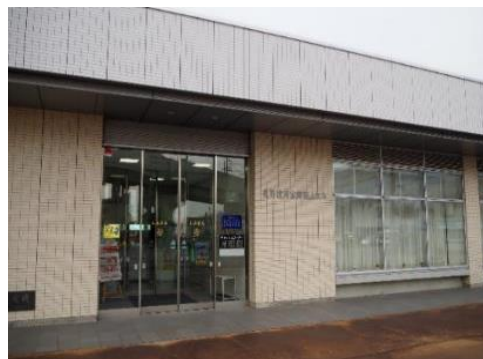
長野信用金庫 飯山支店 11.1km 車で17分

市内施設等(所要時間等は登録日時点です。開閉館日、定休・店休日等は各施設等にお問い合わせください。)