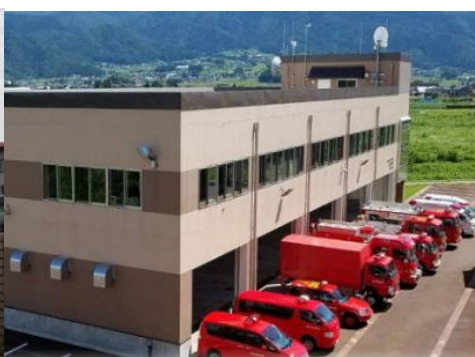
岳北消防本部 10.9km 車で15分