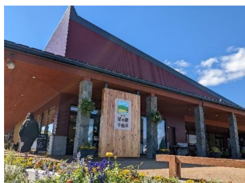
道の駅 花の駅・千曲川 6.6km 車で10分