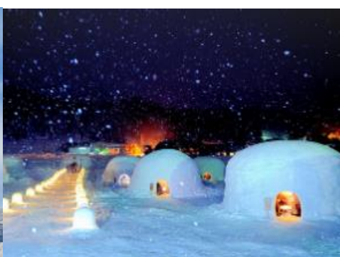
かまくらの里 4.4km 車で6分