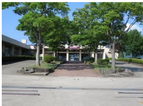
飯山養護学校 11.0km 車で19分

市内施設等(所要時間等は登録日時点です。開閉館日、定休・店休日等は各施設等にお問い合わせください。)