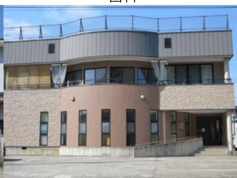
ふじまき歯科 1.8km 車で3分 歯科