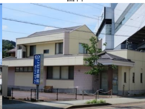
こだま眼科クリニック 11.1km 車で17分 眼科