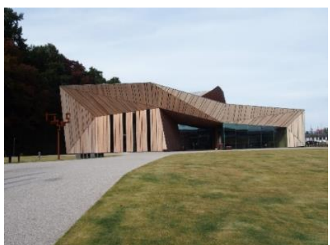
飯山市文化交流館なちゆら 10.3km 車で15分