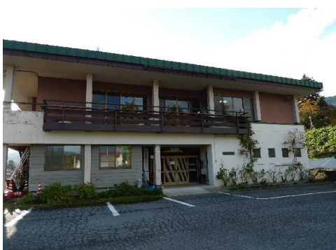
太田地区活性化センター(市出先機関) 0.7km 車で1分