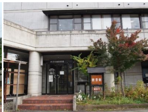
市立飯山図書館 10.3km 車で15分