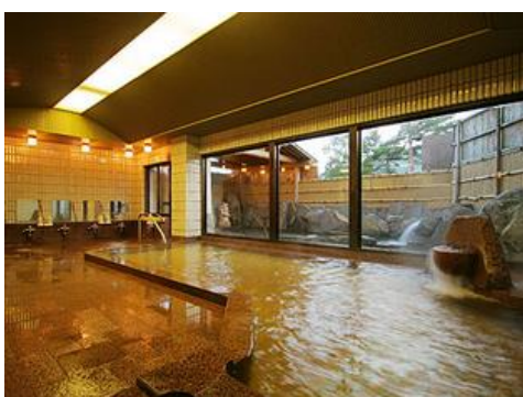
斑尾高原温泉 18.3km 車で25分