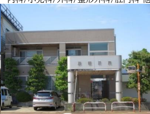
服部医院 10.1km 車で16分 内科/循環器科/小児科