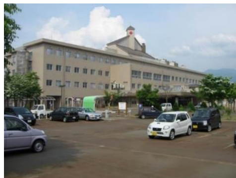
飯山赤十字病院 10.6km 車で17分

市内施設等(所要時間等は登録日時点です。開閉館日、定休・店休日等は各施設等にお問い合わせください。)