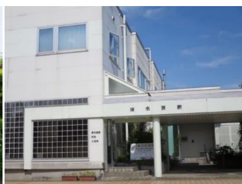
清水(内科小児科)医院 9.4km 車で15分 内科/小児科