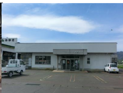
JAながの 常盤支所 6.5km 車で10分