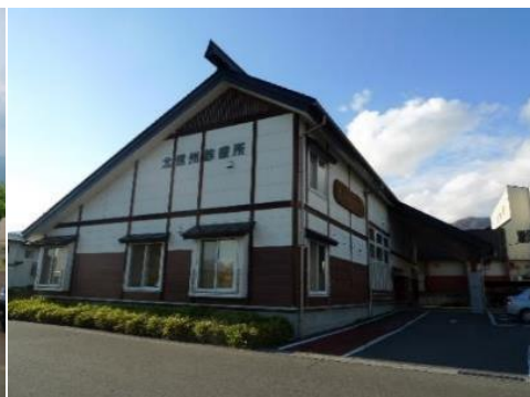
北信州診療所 1.7km 車で3分