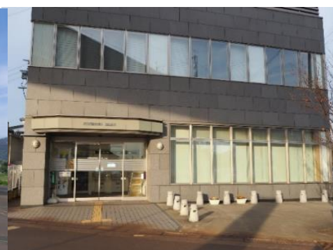
長野県信用組合 飯山支店 11.0km 車で18分